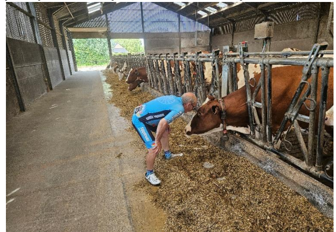
33 "T'as d'beaux yeux tu sais" dira Moustache