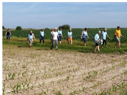
18 Le reste du groupe respire à plein poumons l'air de la campagne brunehautoise