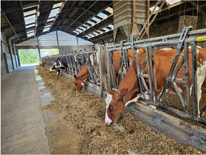
28 I-a qu'à se servir