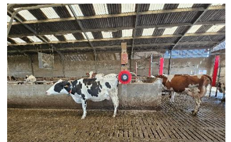
19 Alors que " Marguerite " se dévoile, avant de se rendre à la traite en raison de l'abondance de son lait, les autres s'en contentent... Place à la traite automatique par le robot ici nommé " I-a du lait ".