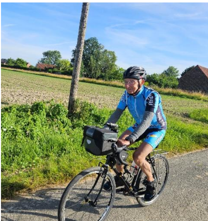
10 Tout comme Marcelino