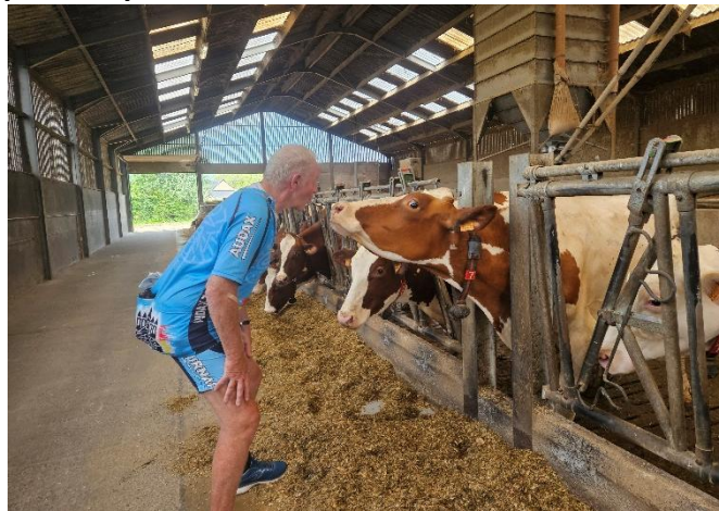
32 Un petit "bisou" de remerciement