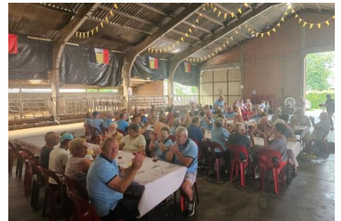
39 Les Audax dans le pré