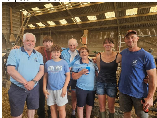
3 La famille réunie au grand complet fils et petits fils en présence du président