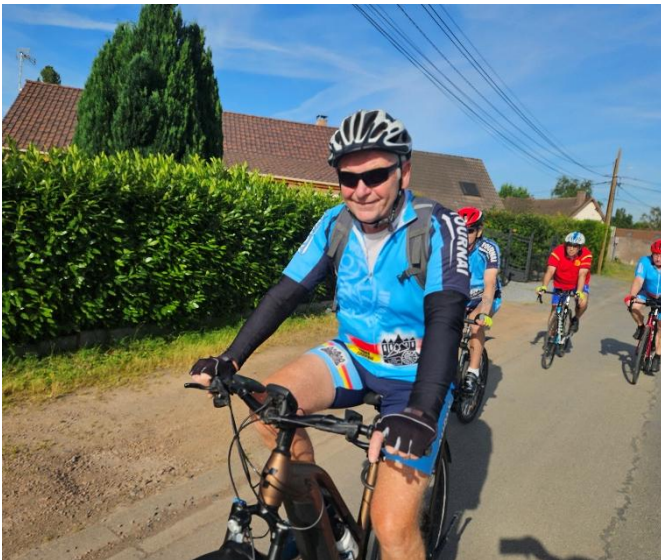
8 Xavier comme d'autres en sont à l'énergie verte