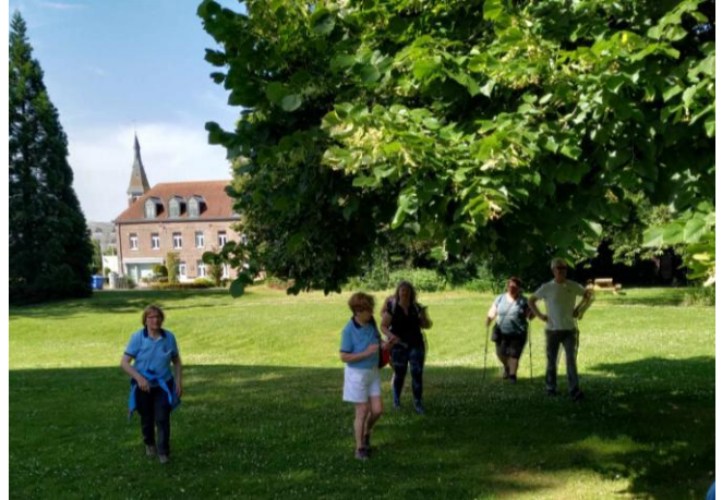
14 La visite débute par un joli parc