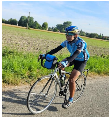
11 " Rat même pas dur "