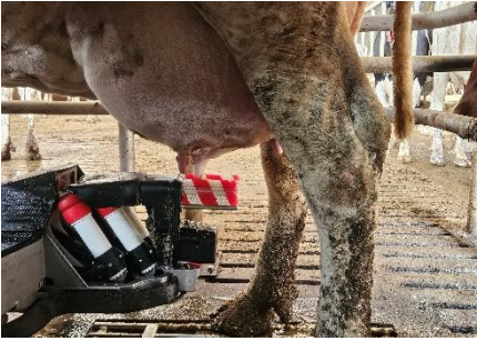
23 Nettoyage du pis avant la traite