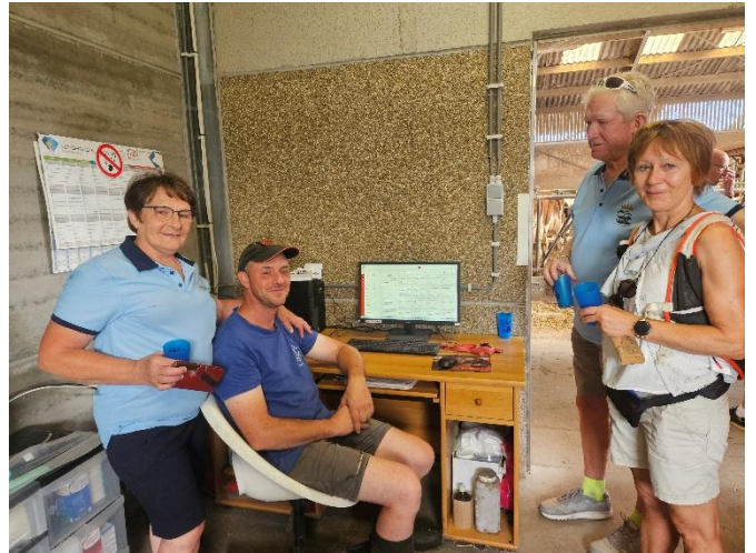
31 Toutes les données du robot sont transmises au pc principal contrôlé par le fiston dont Nelly est très fière