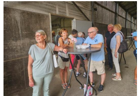
38 Dégustation non pas de lait plutôt de "bulles "