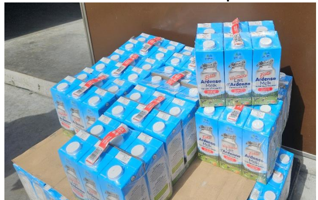
27 Résultat final, dans les berlingots