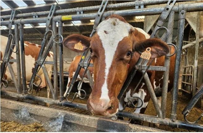
20" Si tu savais, boire, manger, donner ton lait... c'est vache la vie" de vache