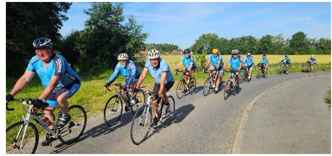
7 Train de sénateur pour cette organisation