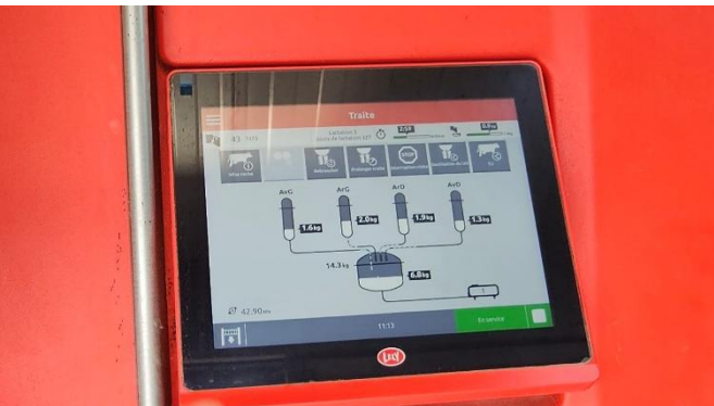
26 Explication détaillée des pis qui ont donné 6.8 kg. Peux faire mieux dira le robot à Marguerite