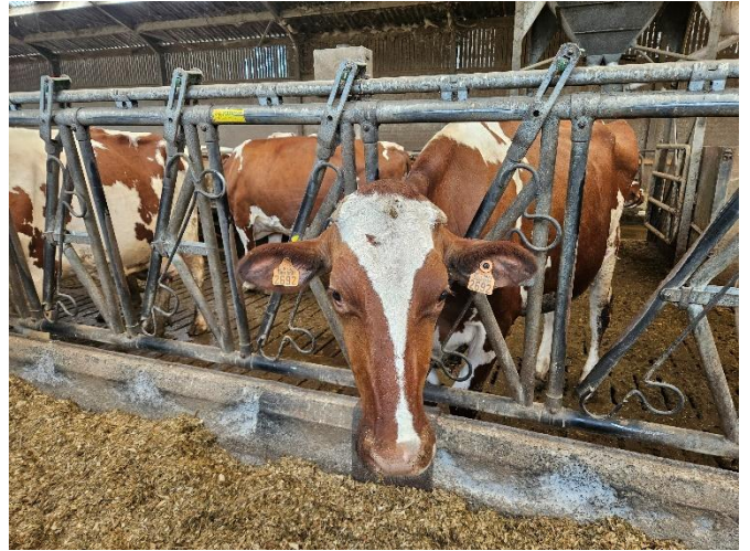
29 Hé vous trouvez ça drôle ?