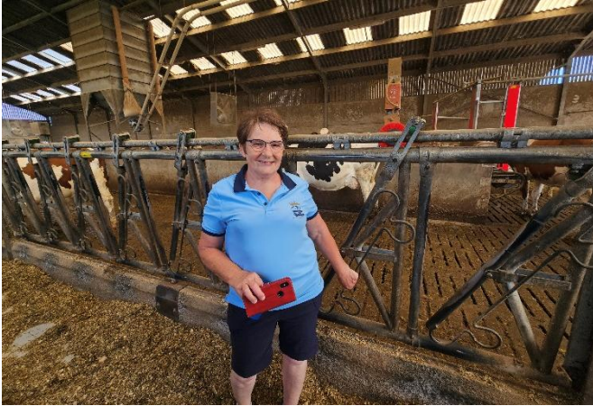
13 Un petit tour à l'étable avant le départ