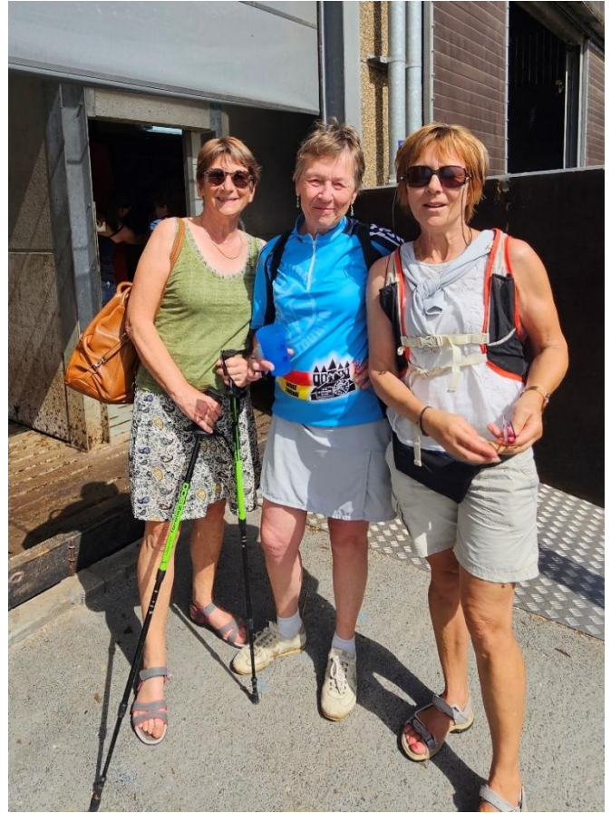
22 " Regardez-les, même pas besoin de lever une patte, tu crois qu'elles font aussi un café pendant que ça traite, si j'étais une vache, je demanderais une télé et des popcorns!"