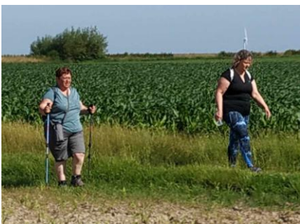
17 On dit que la marche est bonne pour la santé