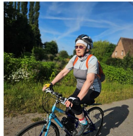
12 Martine suit sans soucis