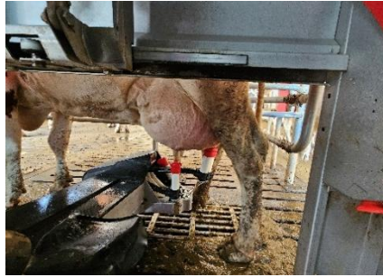
24 Place à la traite