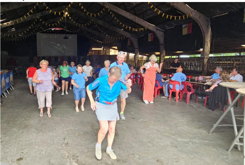
40 Pour terminer la journée, danse de la joie des Audax Tournai