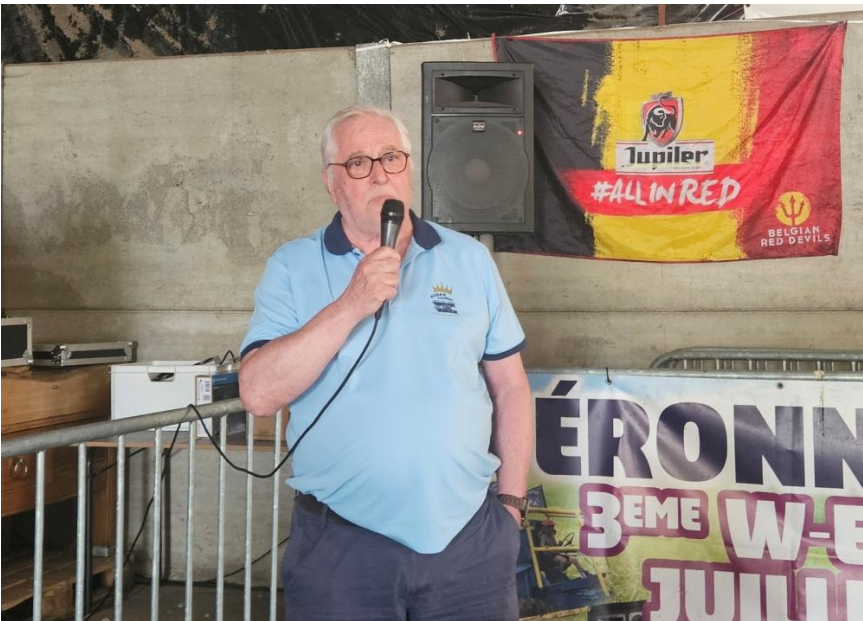
37 Un président heureux de ce BBQ revisité