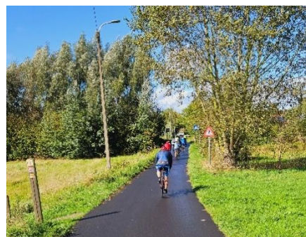
17 Le soleil revient