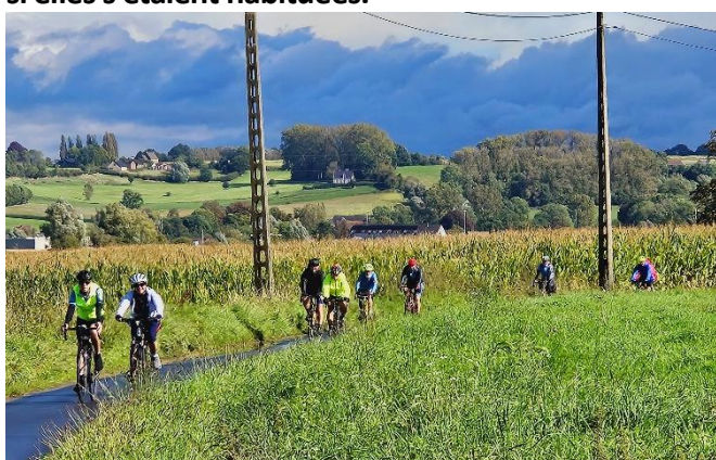
7 Vu le ciel menaçant, accélération du groupe afin d'échapper à la menace qui peu à peu nous rattrape.