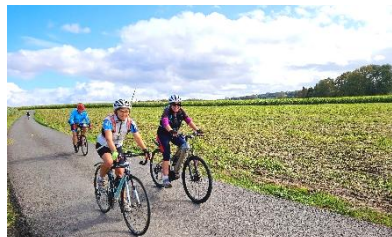
21 En évitant le Koeppenberg