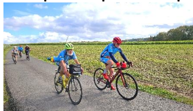
20 Petite route calme