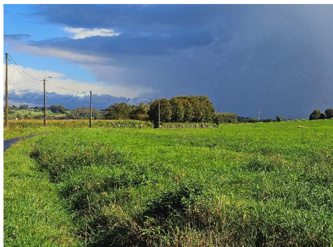
6 Le ciel devient menaçant