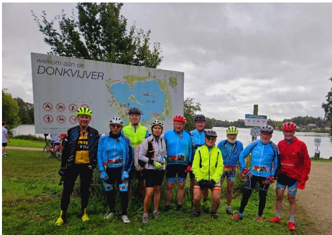
3 1 er arrêt au parc Donkijver à Audenarde