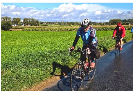
14 Danicau en a vu d'autres