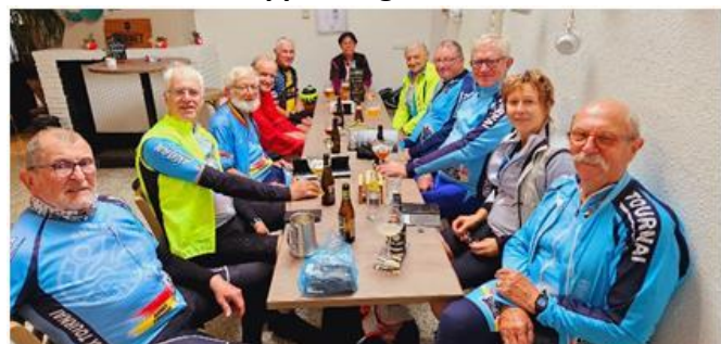
23 La boucle est bouclée, le verre de l'amitié dans la bonne humeur et convivialité

Une organisation impeccable tenue dans le plus grand des secrets