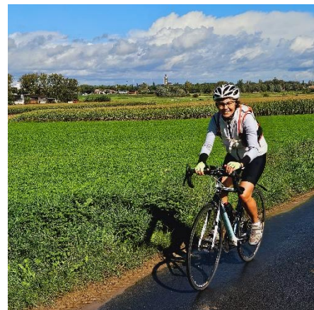
11 Tout comme Catherine