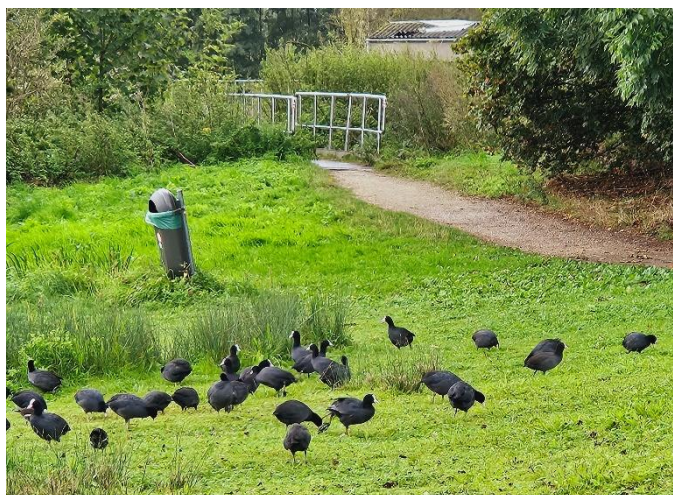
5 Les poules d'eau ne se cachent pas. C'est comme si elles s'étaient habituées.