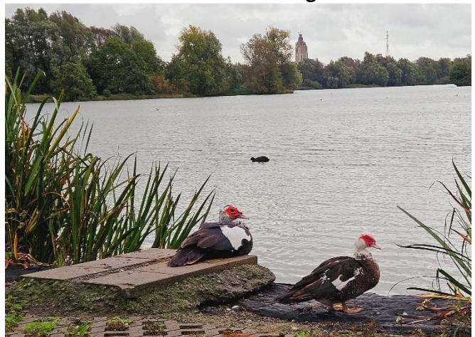
4 Accueil par deux canards pas très dociles