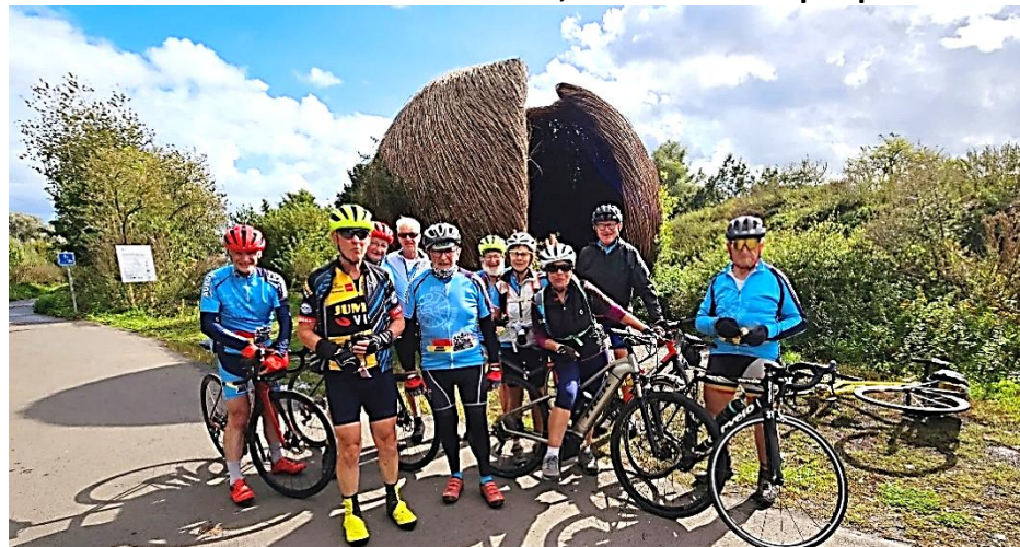
22 Dernier arrêt avant les derniers kilomètres vers Kain