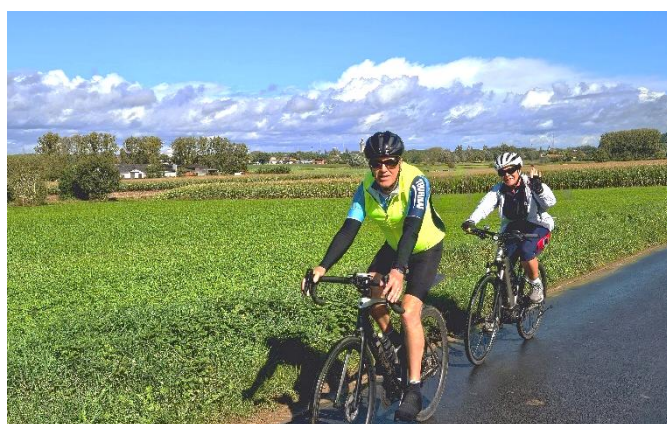
8 Finalement nous y échapperons.